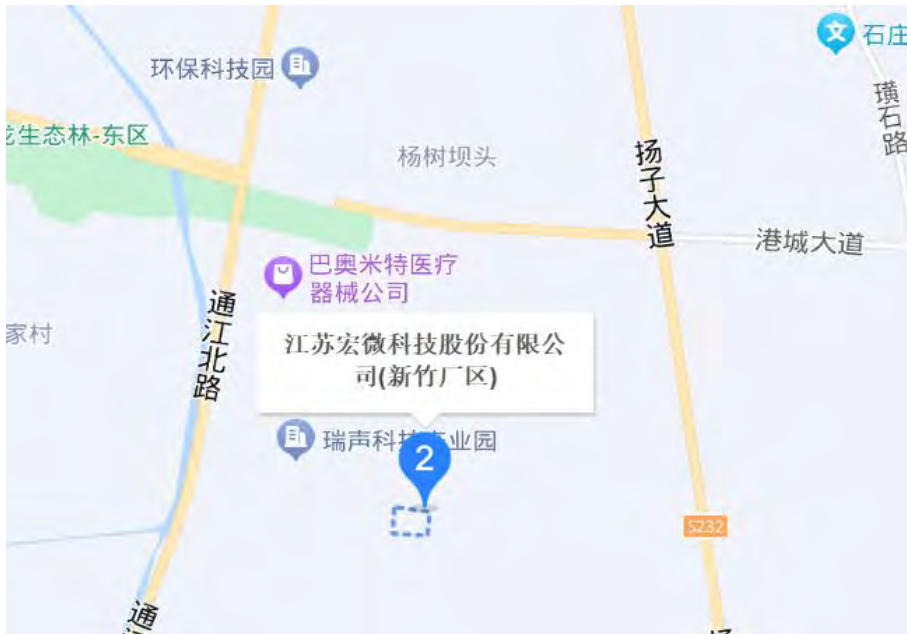
图 3.1 地理位置图